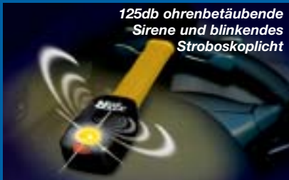
125db ohrenbetäubende Sirene und blinkendes Stroboskoplicht